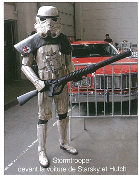
Stormtrooper devant la voiture de Starsky et Hutch